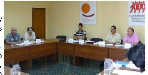
Última reunión de la Sección Sindical Estatal de Repsol. En Madrid, julio 2010.

Este proceso jurídico-sindical marca un antes y un después para la interpretación sobre la doble escala salarial, siendo buena prueba de esto que los despachos de abogados españoles más prestigiosos recomiendan, a la luz de las sentencias ganadas por USO a Repsol, la eliminación progresiva y de forma negociada de las dobles escalas salariales de los convenios colectivos.